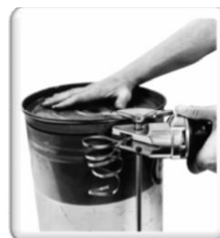
vat knippen met de 19/3514-2